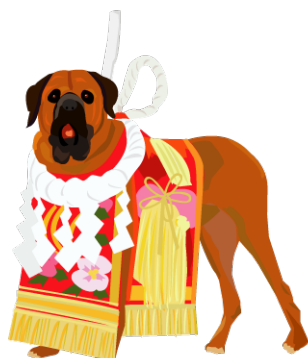
図 2: 土佐犬

次の図 (図:2) は土佐犬の絵です。今度は、png 形式の物にしました。ちょっと、大きいので、半分にしてあります。