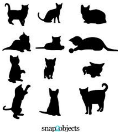
図 1: 猫のシルエット

次の図 (図:2) は土佐犬の絵です。今度は、png 形式の物にしました。ちょっと、大きいので、半分にしてあります。